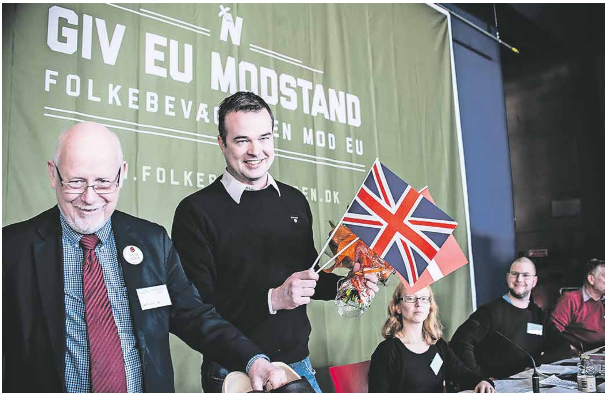
På landsmødet i 2016 gav Folkebevægelsen sin Internationale Træskopris til EU-modstanderen Kelvin Hopkins, som er medlem af det britiske Underhus for Labour. Prisen gives for at stå fast imod EU.