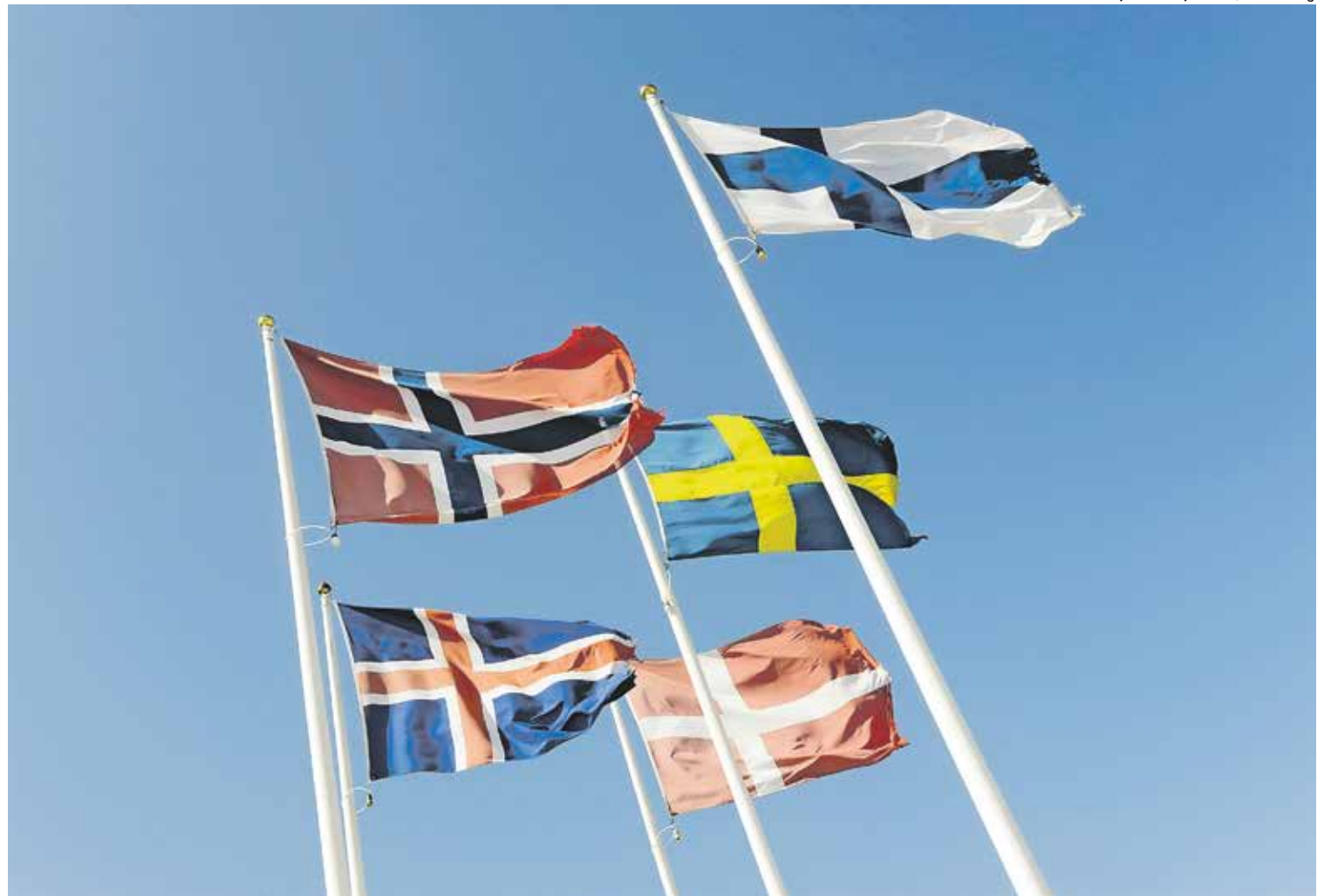
Et konkret alternativ til EU er en styrkelse af det nordiske samarbejde, fx i Nordisk Råd.

Samtidig kan vi fortsat handle med de andre EU-lande. EU-tilhængerne hævder ofte, at en halv million job herhjemme er afhængige af EU's indre marked. Men de glemmer at fortælle, at Danmark